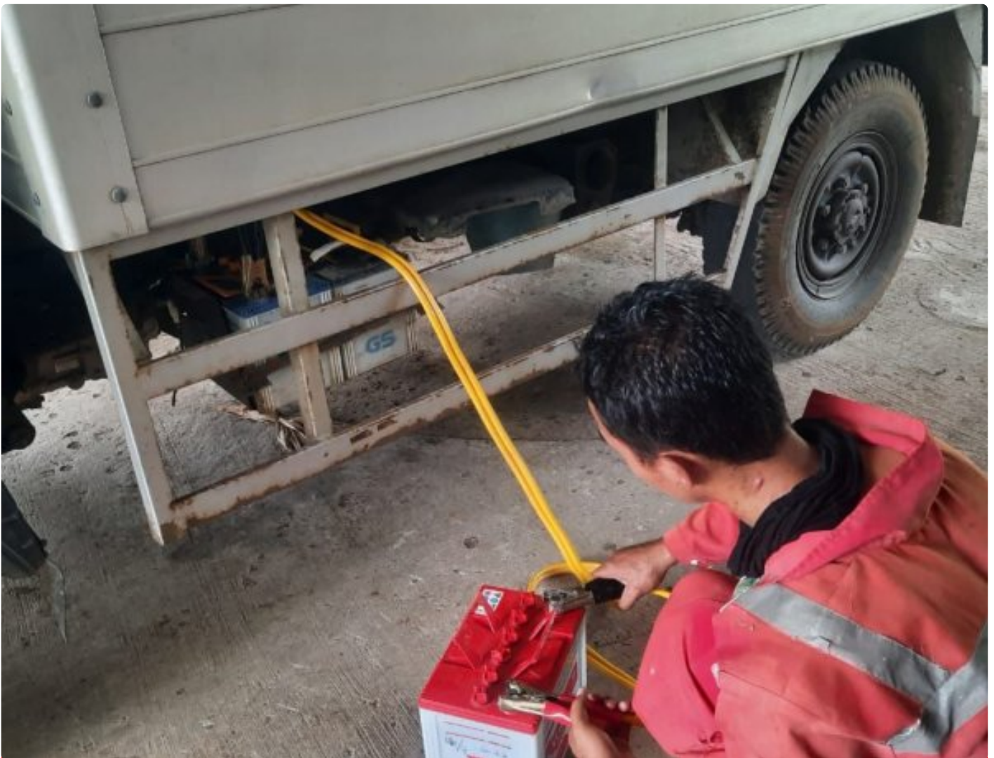
Petugas Staf Umum Lakukan Pengecekan